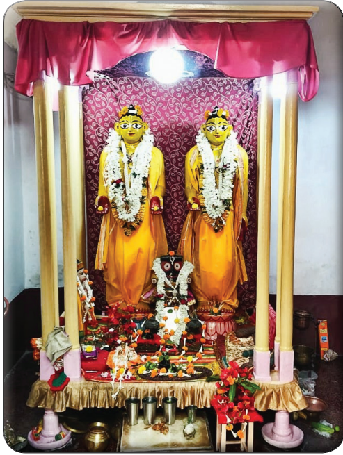
Idols as restored of Sri Chaitanya and Sri Nityananda in this Mandir, Temple

is around 1.2m high. Temple architecture is on 600mm thick load-bearing brick walls and series of load-bearing high brick circular columns of 350mm diameter. Existing flooring is red colour Indian patent stone with decorative borders and designs have also been restored. Walls, columns are with lime-surki based materials. Roof is built by three layer square terracotta thick tiles- 600 x 600mm x 25mm thick with lime-surki mortars, supported by timber long beam ( kari ) and short beams ( barga ). Mandir, temple is painted with lime-based colour, enamel paints in doors, windows, part of columns and beams. Decorative half arch glass skylights on top of double leaf doors on entry wall of natmandir , sanctum sanctorum are carrying architectural glories fitting to temple design. Decorative