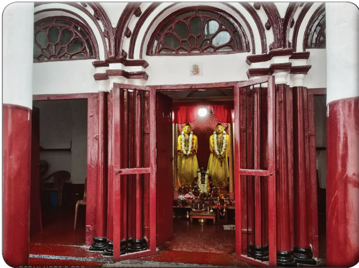
Mandir, Temple after restoration

width of 3m and 1.0m width from main courtyard to temple courtyard. First is in the main entrance before entering into high temple courtyard - natdalan , from building courtyard level. Second is located near bhog-ghar , cooking room in building courtyard level to temple. Level difference between building courtyard and the temple floor